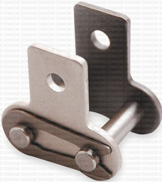
ALETA SK1 o M1